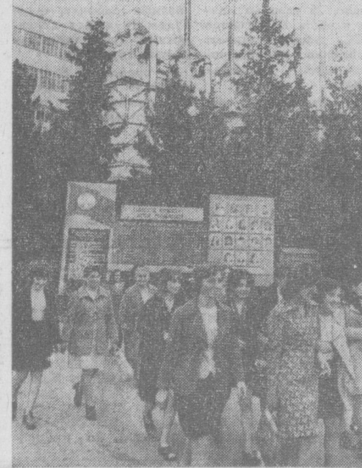
Руставский завод химического волокна — одно из передовых предприятий Грузии.

Тесные деловые связи установились между коллективами двух мебельных предприятий — московской фабрики № 13 и радебергской в ГДР. Москвичи, например, прошли стажировку на автоматических линиях фабрики в Радеберге. Это позволило им сократить период освоения оборудования на своем предприятии и увеличить выпуск кухонной мебели с 25.000 до 100.000 гарнитуров в год.