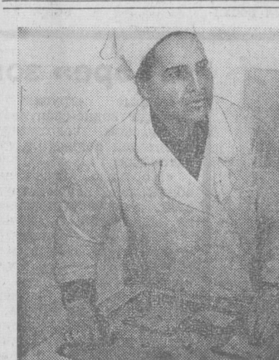
Полклиника № 6 Октябрьского района. Новый флюорографический аппарат поступил на вооружение рентгенолого поликлиники.

С каждым годом аптечные сети города расширяются в зоне кирпичного завода по улице Шахристанской и в еще две новые аптеки.