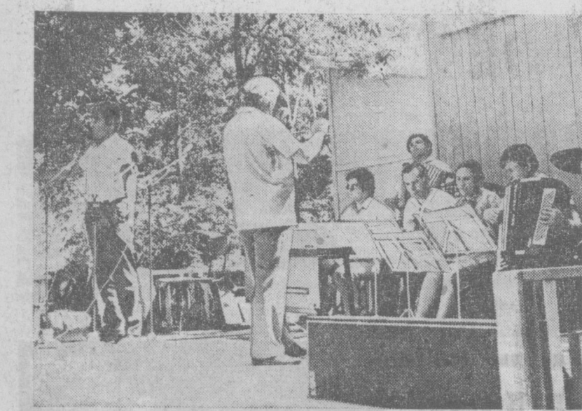
НА СНИМКЕ: перед отдыхающими в парке «Рохат» выступает оркестр Народной филармонии.

Дням культуры в ЦССР в Советском Союзе посвящен вечер в парке имени Тельмана. Много интересного ждет гостей парка имени Ленинского комсомола. Малые и крупные зрители увидят отрывки из спектаклей республиканского театра кукол.