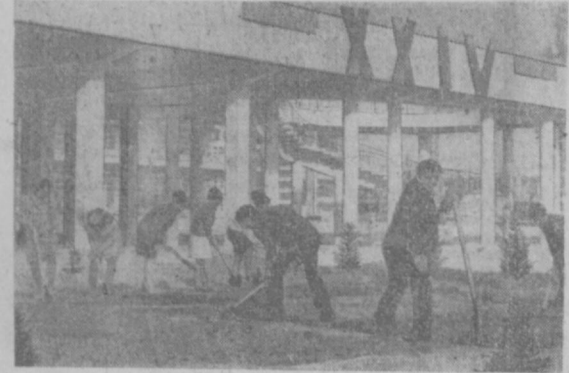
СТУДЕНТЫ 4-го КУРСА РОМАНО-GERMANSKOGO ФАКУЛЬТЕТА ТАШГУ ВЫШЛИ НА ОЧЕРЕДНОЙ СУББОТНИК. ОНИ УБРАЛИ СТРОИТЕЛЬНЫЕ МУСОРЫ, ВЗРЫЛИ ГАЗОНЫ, ПОСАДИЛИ САЖЕНЦЫ НА ТЕРРИТОРИИ УНИВЕРСИТЕТА.

Разбиты цветники. Самой большой — у памятника Владимиру Ильичу Ленину. Работники конструкторского бюро очистки ирригационной системы отремонтировали в ней лотки.