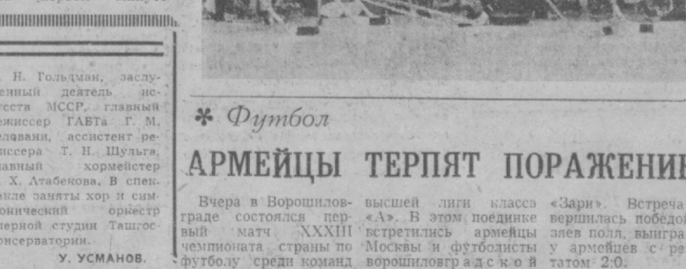
* Футбол Вчера в Ворошиловграде состоялся первый матч XXXIII чемпионата страны по футболу среди команд высшей лиги класса «А». В этом поединке встретились армейцы Москвы и футболисты ворошиловградского «Зари». Встреча завершилась победой хозяев поля, выигравших матч со счетом 2:0.

встречу с американцами с разницей не более чем в четыре шайбы, так как в матче первого круга они одолели сборную США с преимуществом в пять шайб. Американцы победили в своей последней встрече с результатом 5:1. Но эта победа не дала им права остаться в группе сильнейших. НА СНИМКЕ: чемпионы мира — хоккеисты сборной команды Советского Союза.