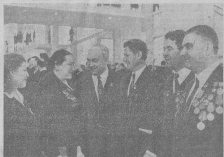
МОСКВА. XXIV СЪЕЗД КПСС. НА СНИМКЕ: в Идеевском Дворце съездов между заседаниями.

В конце заседания с приветствием съезду выступил горячо встреченный делегатами и гостями товарищ РОДОЛЬФО ГЮЛЬДИ — член Исполкома Центрального Комитета Коммунистической партии Аргентины.