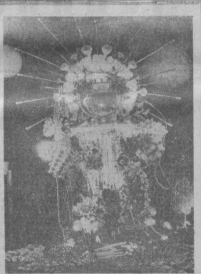
Французский скульптор Жанна Ренюссиер-Конвер сделала из 2 тысяч элитролам почти 300 различных видов фигур «Рыцаря Космоса».