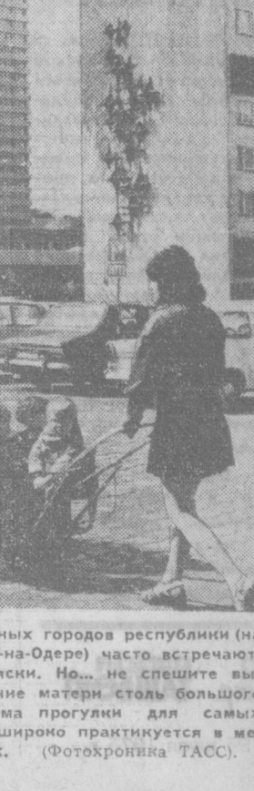
ГДР. На улицах разных городов республики (на снимке — Франкфурт-на-Одере) часто встречаются многочисленные коляски. Но, не спешите выражать свое восхищение матери столь большого семейства. Такая форма прогулки для самых юных воспитанников широко практикуется в местных детских садах. (Фотография ТАСС).

Это уже пятый сложный аттракцион, которым располагают наши парки.