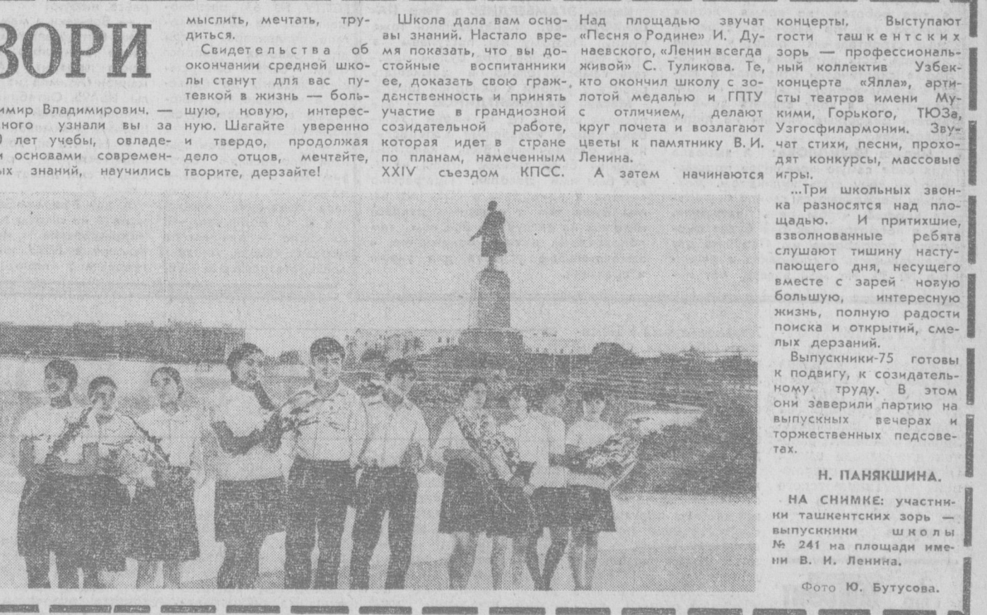
Участники ташкентских зорь — выпускники школ № 241 на площади имени В. И. Ленина.