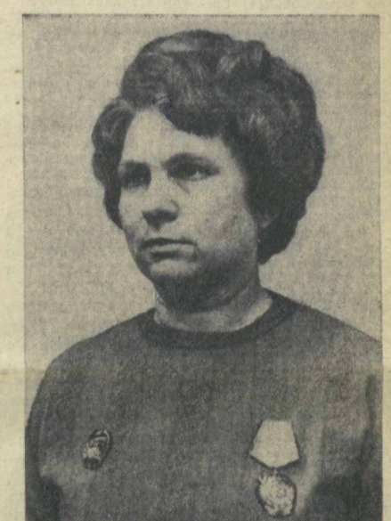
шаем предприятии. 24 производственника, взяв повышенные социалистические обязательства, близки к выполнению второго пятилетнего плана.

Восемнадцать лет назад поступила я на швейную фирму ученицей. За это время выросла в передовую производственницу, стала активно участвовать в общественной жизни предприятия. Я освоила две смежные специальности, могу в случае надобности заменить основщицу и комплектовщицу. За опыт, мастерство мне присвоен высший — пятый разряд. Сейчас работаю на ответственном участке — ленточной резке деталей. От работы раскройщицы зависит многое. Ведь правильный раскрой материала — залог удачного пошива костюма, брюк, куртки. В процессе труда я выработала для себя четкие правила, которым слеую неукоснительно. Прежде всего большое внимание уделяю профилактическому осмотру оборудования, чтобы быть уверенной, что в середине смены не придется вызывать мастера-наладчика. Следующая забота раскройщицы — четкая и продуманная организация трудового процесса. Рабочую минуту ценю на вес золота. И результат не замедлил сказаться — норма выработки в среднем составляет 205 процентов. План девятой пятилетки я выполнила за 2,5 года. За трудовые успехи была награждена орденом Трудового Красного Знамени. Еще одно пятилетнее задание я обязалась выполнить к 30 декабря 1975 года. В цифрах это выглядит так: раскрою 1 миллион 267 тысяч полуфабрикатов, на 649 тысяч больше плана. Почин девяти был широко подхвачен на на-