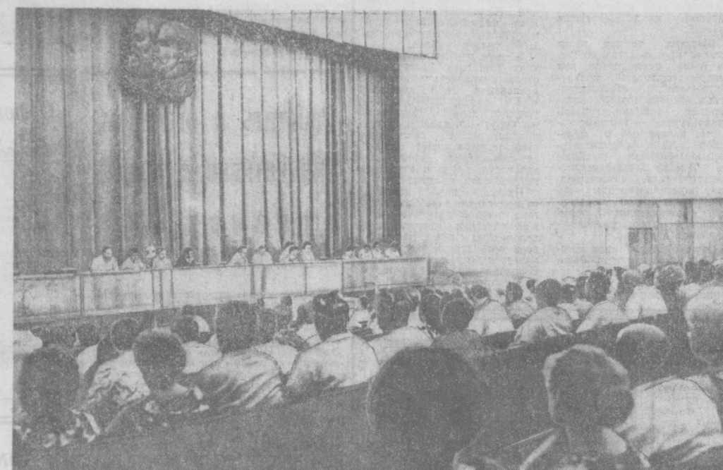
НА СНИМКЕ: В ЗАЛЕ КОНФЕРЕНЦИИ.

Научно-методическая конференция показала возросший уровень марксистско-ленинской учебы и экономического образования кадров в Ташкентской городской партийной организации, наметила перспективы дальнейшего совершенствования этой работы, повышения трудовой и политической активности трудящихся столицы в борьбе за досрочное завершение планов пятилетки за достойную встречу XXV съезда КПСС.