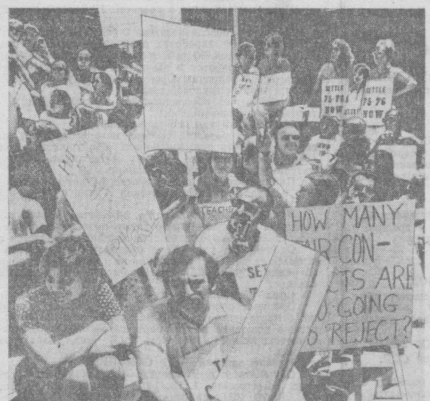
Трудящиеся Соединенных Штатов Америки дают отпор наступлению монополий на их жизненные права. Согласно официальным данным министерства труда, только в апреле этого года в стране были зарегистрированы 741 забастовка. В них участвовали более 221 тысячи американцев. НА СНИМКЕ: бастующие учителя в Норуплке (штат Коннектикут).

РИМ. Пра-вля не крути Тель-Авива не намерены отказываться от агрессивного милитаристского курса во внешней политике. Об этом наглядно свидетельствует недавно принятый в министерстве Государственный бюджет на 1975—1976 годы. На 56,2 млрд. ирландских фунтов почти половина предназначена на военные расходы. Кроме того, 13 процентов бюджета отчисляются на оплату непомерно больших долгов и процентов по ним, также связанных с военными расходами. По признанию министра финансов Рабиневича, внешний долг Израиля достиг 8 млрд. долларов. Тяжелым предост. тяжелый год. Это даже не могут скрыть руководители Израиля, призывающие затанцевать пося и смирились с дальнейшим снижением жизненного уровня.