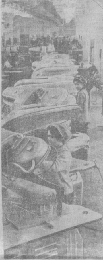
НА СНИМКЕ: новый пресловый участок в новом производственном корпусе швейной фирмы «Юлдаз». Здесь установлено первоклассное оборудование.

Коллективы предприятий промышленности, транспорта и связи, строительного-монтажных организаций столицы Узбекистана, широко развернув социалистическое соревнование за достойную встречу XXIV съезда партии, добились в первом квартале определенных трудовых успехов. Более 70 коллективов предприятий и строительно-монтажных организаций рапортовали о досрочном выполнении предсъездовских обязательств. Промышленностью города реализовано сверх квартального плана продукции на 15,5 миллиона рублей. Особенно хороших результатов добились предприятия Хамзинского района, выполнившие квартальный план по реализации продукции на 105,3 процента. Наличные показатели по выпуску и реализации народнохозяйственных изделий достигли коллективы заводов: авиационного, «Ташсельмаш», трактороборочного, «Ташкентабель», инструментального, электронной техники, тракторного, холодильников, ремонтно-механического, гражданской авиации, швейной фирмы «Красная звезда», автокомбината № 3, строительных трестов №№ 3, 153, 159, «Ташинжстрой», «Отделстрой», «Средтазтрансстрой», «Ташинтегазмонтаж» и других. Рассмотрев итоги социалистического соревнования между районами и предприятиями города за первый квартал, Ташкентский горком партии и Ташгорисполком признали победителем в соревновании Хамзинский район. Переходящее Красное знамя горкома партии и Ташгорисполкома оставлено на постоянное хранение в Хамзинском районе. Отмечена хорошая работа предприятий Сабир Рахимовского, Ленинского и Чиланзарского районов.