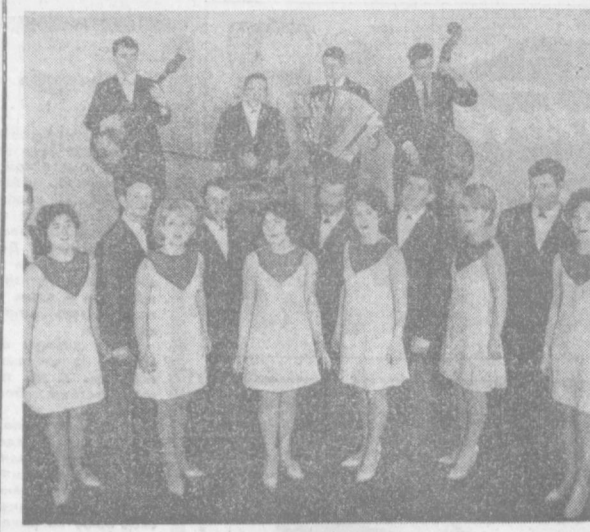
ВЫСТУПАЕТ АНСАМБЛЬ «ЧАЙКА»

В своеобразии русской природы Леонов склонен видеть причину своеобразия русского национального характера. Не случайно крупнейшим созданием советской литературы оказался роман «Русский лес» — произведение, выходящее по интеллектуальной насыщенности, богатству исторической и философской проблематики, по чудесному языковому и композиционному мастерству. «Русский лес», получивший первый Ленинский премию, был оценен как ярчайшая картина борьбы русских, советских народных начал с антинародными, борьбой социализма — с фашизмом. Как роман о дружге гуманизма и социализма, об ответственности перед будущим, перед потомками. В последние годы не раз звучал голос Леонова — борца за мир, подлинно человеческую культуру, за самое существование человеческого. Чтобы не превратилась чудесная и многострадальная земля наша в звездочку — голубоватую и необитаемую... Пусть здравствует «простой человек, который пишет черным по белому для миллионов своего народа». Слава человеку! Николай МАЛАХОВ.