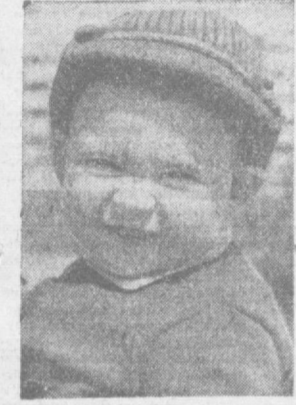
Стихи Дмитрия ПОЛИНИНА.