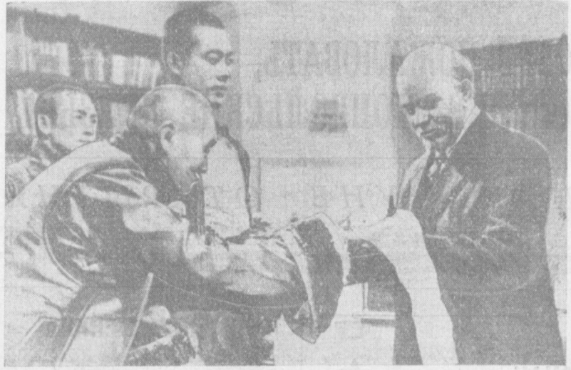
НА СНИМКЕ: КАДР ИЗ НОВОГО МОНГОЛЬСКОГО ХУДОЖЕСТВЕННОГО КИНОФИЛЬМА «УРТО». ВСТРЕЧА СУХЭ-БАТОРА С В. И. ЛЕНИНЫМ.

Несколько дней назад завершился визит в братскую Монголию Председателя Президиума Верховного Совета СССР Н. В. Подгорного. Этот визит еще раз ярко продемонстрировал нерушимое единство СССР и МНР, их верность принципам марксизма-ленинизма, интернационализма.