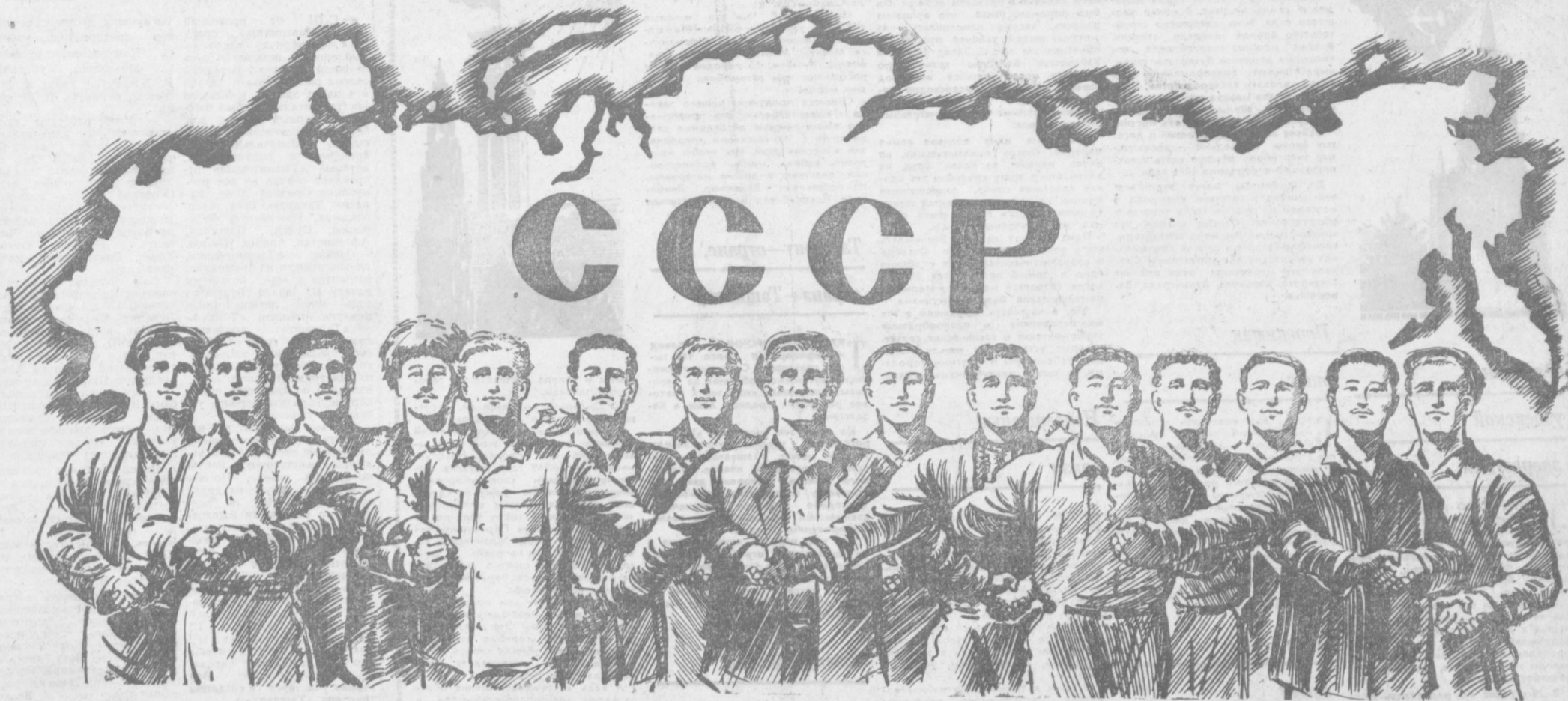
Рисунок народного художника Узбекской ССР В. Найдалова.