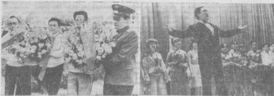
На фестивале дружбы советской и монгольской молодежи. НА СНИМКАХ: слева — почетные гости фестиваля в момент возложения венков и памятнику В. И. Ленина. Справа — группа участников фестиваля на концерте в Клубе дружбы.

В чем, коротко, суть этих связей? (Продолжение на 2-й стр.)