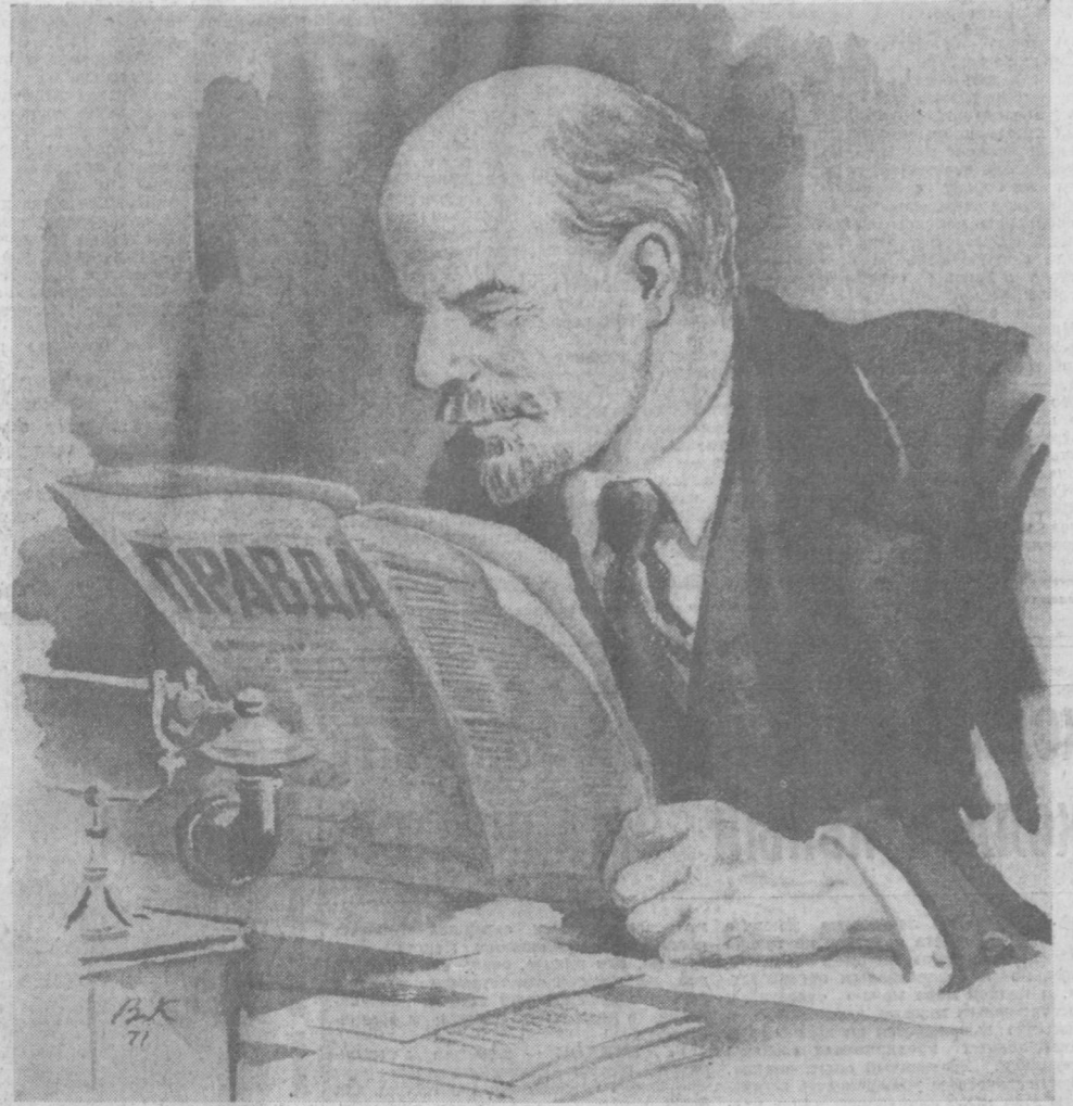
Рисунок народного художника Узбекской ССР В. Кайдалова.