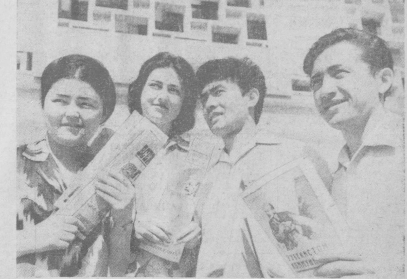
Подготовка к дню выборов в полном разгаре. Тысячи агитаторов проводят с избирателями тематические беседы, дают нутнюю консультацию на агитпунктах, здесь же помогают выверить списки избирателей своего участка.

Этот салон открылся недавно по улице Пушкинской, 39. Здесь можно заказать модельную обувь, которую изготавливают опытные мастера