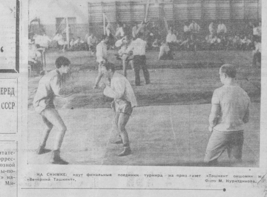
НА СНИМКЕ: идут финальные поединки турнира на приз газет «Тошкент окшом» и «Вечерний Ташкент».