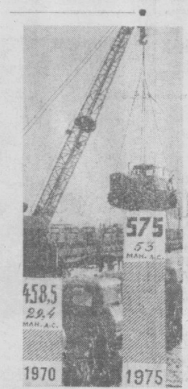
ПРОИЗВОДСТВО ТРАКТОРОВ В НОВОЙ ПЯТИЛЕТКЕ (в тысячах штук)

Проблему электрификации всей страны КПСС рассматривает в неразрывной связи с созданием новых, наиболее прогрессивных средств труда, новой производственной базы в промышленности и сельском хозяйстве. Осуществление комплексной механизации и автоматизации производства, совершенствование технологических процессов, организация новых отраслей производства и достижение необходимой для победы коммунизма производительности общественного труда воз-