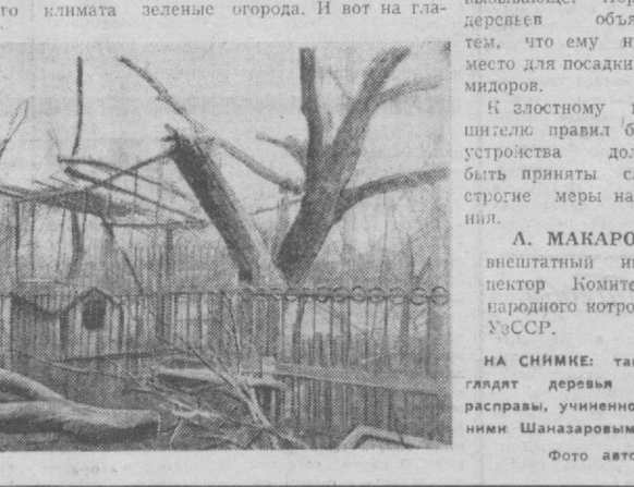
НА СНИМКЕ: так выглядят деревья после расприва, учиненной над ними Шаназаровым.

обсуждена на производственном совещании со всеми задействованными магазинами. Факты подтвердились. В настоящее время все магазины, в том числе и магазин № 127, полностью обеспечены выклами для отбора хлебобулочных изделий.