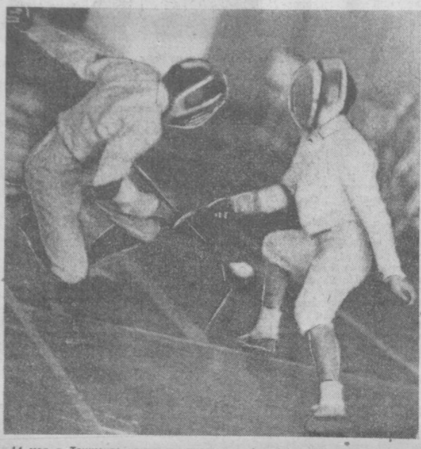
14 мая в Ташкенте начались поединки фехтовальщиков.

Отличительной чертой спартакиады является и широкая география мест соревнований. Поединки будут проходить в Бухаре и Фергана, борцов — Намангане и Самарканде, гребцов — Бекабаде, ватерполистов — Навои и др. Сандетелями многих интересных составов станут и ташкентцы. А вот грековники, среди которых есть даже чемпионы мира, пришлось совершить путешествие на самолете во Фрунзе, прежде чем сесть в седло велосипедов. В Ташкенте грековники — велосипедисты, грековники и мастера парусного спорта впервые оспаривают звание чемпионов. Новшеством будет и то, что в этом году спартакиада проводится одновременно для сборных команд Ташкента, области и Каракалпакки и сборных коллективов Центрального и республиканских советов ДСО и ведомств.