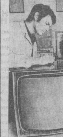
Завод «Видеотон» в городе Семешеваре приступил к выпуску первых венгерских цветных телевизоров под названием «Видеолор» (на снимке — в экспериментальном цехе). В дальнейшем их производство будет поставлено на конвейер. Пробные цветные передачи ведутся в стране уже более года.