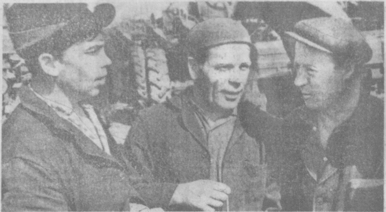
По ударному началу первый год пятилетия тракторостроители. Коллектив обязался завершить годовую план 28 декабря, реализовать сверхпланы дополнительно и заданию 100 тракторов, 420 прицепов, 25 автопоездов. И в эти дни каждый машинист-строитель трудится только высоким качеством.