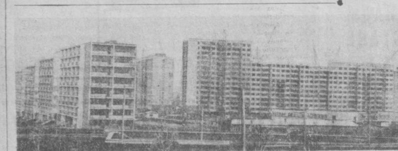
Население столицы Чехословакии Праги перешагнуло за миллион и достигло 1.104 тысячи человек. Для удовлетворения потребностей населения в жилье в ближайшие десять лет запланировано построить на севере столицы новый город на 80 тысяч жителей. На снимке: вид на один из кварталов нового города, строительство которого будет закончено в ближайшие время.

ГАВАНА. Народное хозяйство Кубы пополнилось большой группой молодых специалистов — инженерами-теплоэнергетиками, специалистами в области водной и агрономии. Их выпустил технологический институт «Альваро Рейносо» в провинции Матансас. За 6 лет существования это учебное заведение уже подготовило около 1.000 специалистов различного профиля. До революции на Кубе почти не готовились технические специалисты. Революционные правительство, стремясь как можно быстрее покончить с экономическим отсталостью, придает первоочередное значение формированию национальных кадров, способных управлять сложной современной техникой и выполнять важные народнохозяйственные задачи.