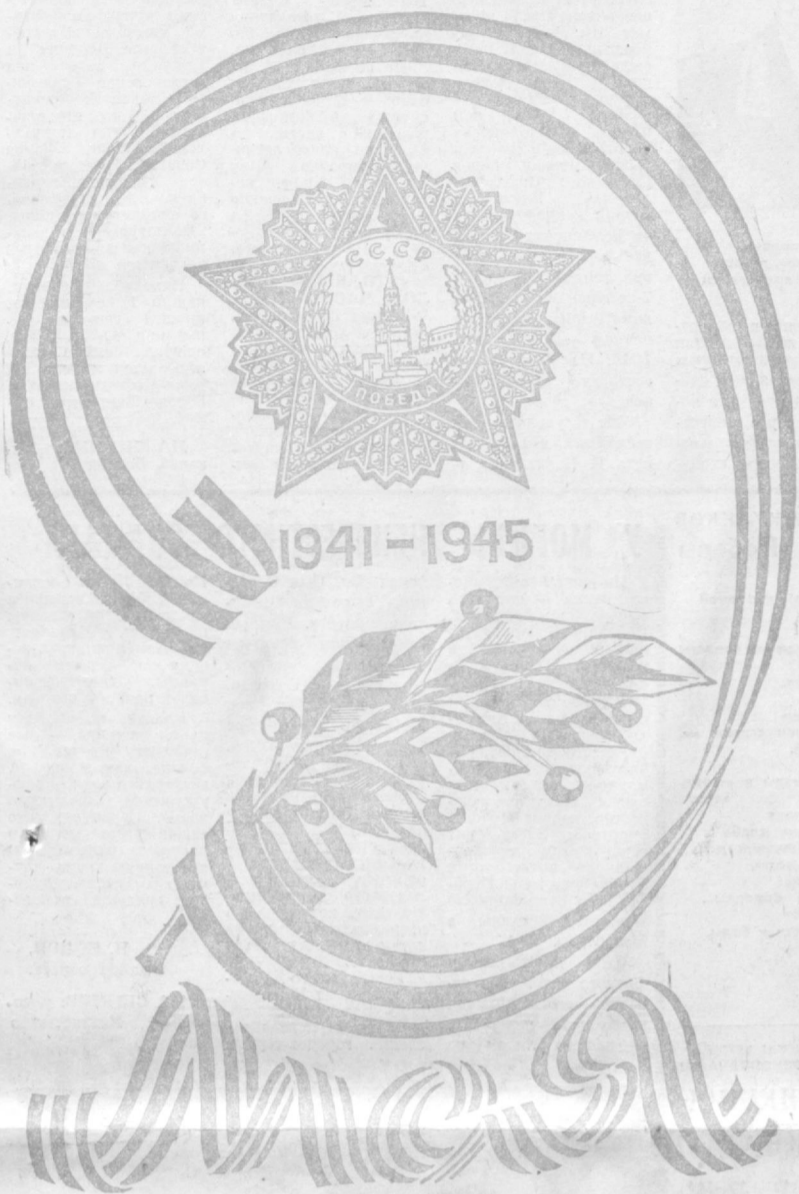
Рис. А. Багдасарьян.