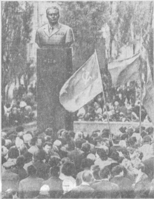
Во время митинга в Днепродзержинске.

В ОЗНАМЕНОВАНИЕ выдающихся боевых и трудовых заслуг Героя Советского Союза, Героя Социалистического Труда, Генерального секретаря ЦК КПСС Леонида Ильича Брежнева в городе Днепродзержинске Днепропетровской области — на родине Героя — сооружен бронзовый бюст, как установлено Указом Президиума Верховного Совета СССР.