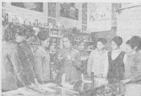
Срок обучения — 1 и 2 года.

УЧИЛИЩЕ ГОТОВИТ ВЫСОККВАЛИФИЦИРОВАННЫХ ПРОДАВЦОВ БАКАЛЕЙНО-КОНДИТЕРСКИХ ТОВАРОВ, ГАСТРОНОМИЧЕСКИХ, МЯСО-РЫБНЫХ, МОЛОЧНЫХ ТОВАРОВ, ПРОДАВЦОВ ТКАНЕЙ, ШВЕЙНЫХ ИЗДЕЛИЙ, ОБУВИ, ТРИКОТАЖА, ГАЛАНТЕРИИ, ПАРФЮМЕРИИ, ТОВАРОВ ПОСУДО-ХОЗЯЙСТВЕННОГО И КУЛЬТУРНО-БЫТОВОГО НАЗНАЧЕНИЯ, А ТАКЖЕ ПРОДАВЦОВ-КОНСУЛЬТАНТОВ И ПРОДАВЦОВ-КОНТРОЛЕРОВ-КАССИРОВ.