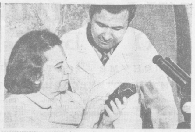
ТАШКЕНТ — НЕЧЕРОЗОМЬЮ

Для народного хозяйства Коллектив нашего института наряду с фундаментальными исследованиями по проблемным вопросам ядерной физики, физики атомного ядра, радиационной физики твердого тела, радиационной химии и ряду других научных направлений проводит работы по прикладным народнохозяйственным задачам. На базе исследований института проводится анализ фундаментальными исследованиями по проблемным вопросам ядерной физики, физики атомного ядра, радиационной химии и ряду других научных направлений. Методы контроля продукции и тугоплавких металлов, при Министерстве геологии Узбекской ССР. Почти 60 организаций республики и Союза используют результаты исследований наших ученых в самых различных научных и производственных направлениях. Для этих целей институт выполняет около 100 тысяч элементноопределений в год. С помощью полуавтоматической измерительной установки по определению содержания марганца в почве составлены картограммы для 14 хлопководческих хозяйств Ташкентской области, а к концу года будут результаты по всем ее хозяйствам. Р. КАПНОВ, научный секретарь института ядерной физики.