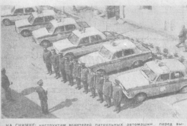
НА СНИМКЕ: инструктаж водителей патрульных автомашин перед выездом на дежурство.

Помощники ГАИ В период Всесоюзного смотра безопасности дорожного движения сотрудниками ГАИ с помощью общественности выявлено более девяти тысяч нарушений правил движения пешеходами и около 14 тысяч — водителями. Особенно хорошо поработали в эти дни общественные инспекторы и внештатные госавтоинспекторы: