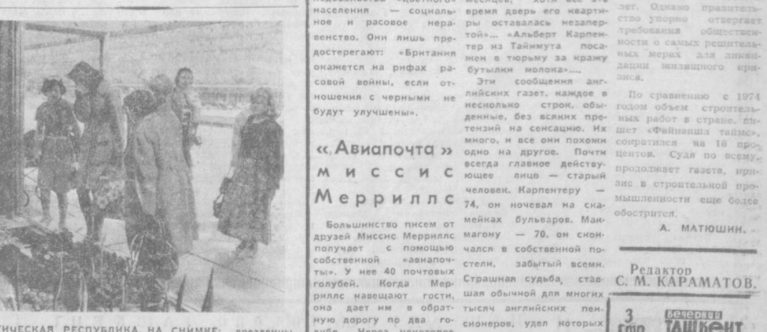
ГЕРМАНИЙСКАЯ ДЕМОКРАТИЧЕСКАЯ РЕСПУБЛИКА. НА СНИМКЕ: дрезденцы очень любят цветы.

По сравнению с 1974 годом объем строительных работ в стране, ожидает «Финанш таймс», сократился на 16 процентов. Судя по всему, продолжает газета, кризис в строительной промышленности еще более обострится.