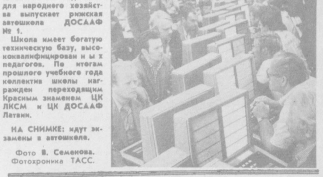
НА СНИМКЕ: идут экзамены в автошколе.