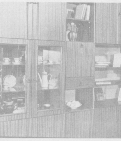
Коллектив ленинградского научно-производственного объединения «Ленпроектмебель» разработал