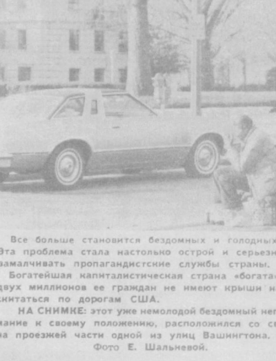
Все больше становится бездомных и голодных в Соединенных Штатах. Эта проблема стала настолько острой и серьезной, что ее уже не могут замалчивать пропагандистские службы страны. Богатейшая капиталистическая страна «богата» своей бедностью. Более двух миллионов ее граждан не имеют крыши над головой и вынуждены сниться по дорогам США. НА СНИМКЕ: этот уже немолодой бездомный негр, чтобы привлечь внимание к своему положению, расположился со своими пожитками прямо на проезжей части одной из улиц Вашингтона.