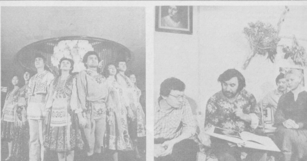
В коллективах художественной самодеятельности

ОТКРЫТ НОВЫЙ КОМПЛЕКС Кабульского медицинского института имени Абу Али ибн-Сины.