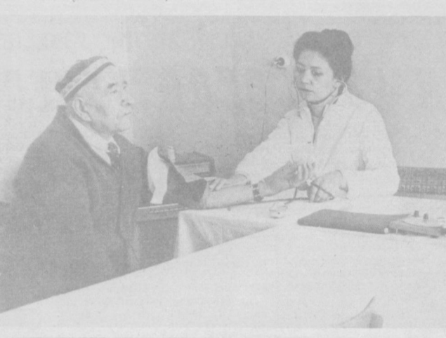
НА СНИМКЕ: в библиотеке и на приеме у врача.

«ВЕТЕРАН» ПОМОГ ИЗВИНИЛИСЬ И... РАСПЛАТИЛИСЬ. В редакцию обратился Е. Михиник с жалобой на то, что в Хамзинском райсобесе никак не может получить единовременное пособие, так как там потерям представленную ему справку. Как ответила зам. начальника Управления социального обеспечения, так как там потерям представленную ему справку. Как ответила зам. начальника Управления социального обеспечения,