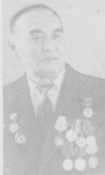
В числе первых посланцев Узбекистана в тридцатые годы он окончил Ивановский текстильный институт и получил диплом инженера хлопчатобумажного производства. Работал старшим мастером на Ташкентском текстильном комбинате, в партийных органах, на ответственных хозяйственных должностях.