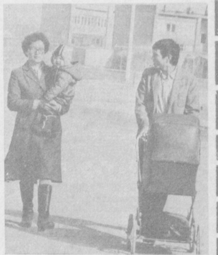
доставленные сюда на кинорежиссерах. Слово, мы стараемся максимально приблизиться к привычному... Расплетаются деревья, пробиваются первые зеленые ростки не богатой степной растительности. Люди живут и радуются жизни. Примечательный факт: на разрушенных подземной стихией улицах города звучит детский смех. Для того, чтобы он не стихал, сутками трудятся отцы, матери и стар- От специальных корреспондентов газеты «Вечерний Ташкент». НА СНИМКАХ: будни Гази. Гази, 27 марта.