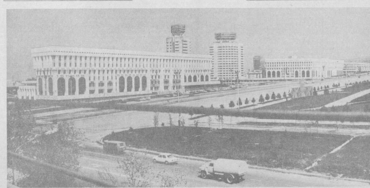
НА СНИМКЕ: Алма-Ата. Площадь имени Л. И. Брежнева.

рвовозостроительного завода. Теперь этот флагман машиностроения республики выпускает более 50 видов протанков, волоочильного и другого металлургического оборудования. (Окончание на 2-й стр.)