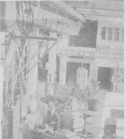
Многотрачными и радиогазетными предприятиями и организациями района в эти дни широко освещается ход подготовки проведения 21 апреля 1984 года ленинского коммунистического субботника.