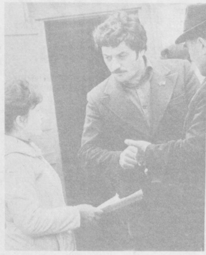
По законам братства