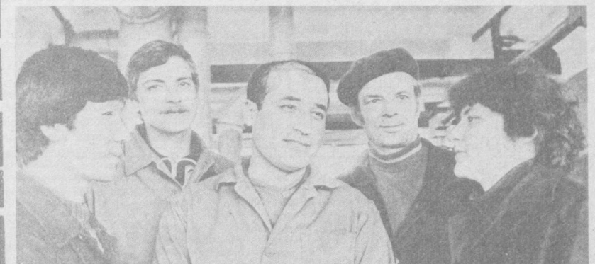
Будет труд ударным

Для организации проведения коммунистического субботника на заседании бюро района партии был создан штаб, который на своих заседаниях периодически заслушивает отчеты руководителей предприятий и организаций о ходе подготовки к субботнику. По предварительным подсчетам, предприятия района выпустят продукции на 228 тысяч рублей, в том числе товаров народного потребления на 178 тысяч. На заводе «Средгазавтоматика», в частности, будет выполняться заказ для строителей