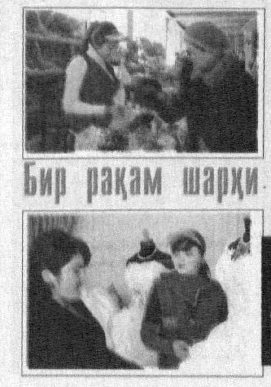
Бир рақам шарҳи

Хизмат кўрсатиш ва сервис соҳасини ривожлантириш дастури доирасида амалга оширилган ана шу тадбирлар, ўз навбатида, жойларда аҳолига замонавий, сифатли хизматлар кўрсатиш, соҳанинг иқтисодий дидегаги ўрнини ошириш, қўшимча иш ўринларини яратиш имконини берди.