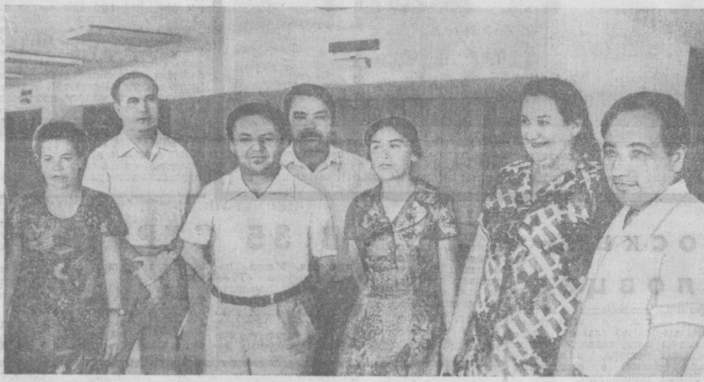
НА СНИМКЕ: группа участников конференции.

Накопленный опыт внедрения активных форм экономической учебы говорит о том, что необходимо и дальше совершенствовать методику проведения занятий, применять эффективные способы и средства обучения, широко использовать полученные знания в практической деятельности.