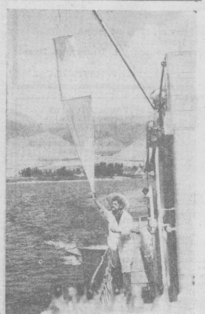
КИРГИЗСКАЯ ССР. Сотрудники Иссин-Кульской биологической станции Академии наук Киргизской ССР — ихтиологи, гидрологи, гидрозоологи, географы — кружной год ведут наблюдения за высокогорным озером. Они изучают зоопланктон, дно Иссин-Куля, его течение.

В результате сокращения закупок Японией нефтепродуктов сингапурские нефтеперерабатывающие заводы уже вдвое сократили.