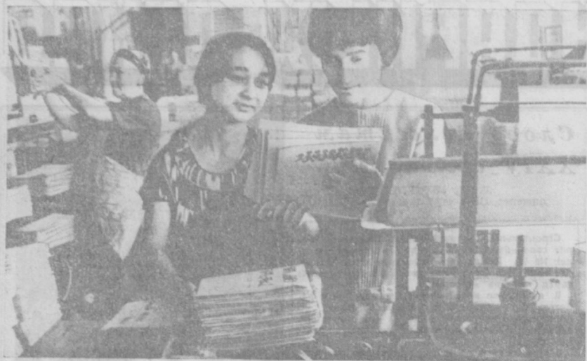
На Ташкентской фабрике офсетной печати установлен новый автоматический конвейер, на много облегчающий труд рабочих переплетного цеха. Это третья по счету новая полиграфическая машина, доставленная из братской ГДР.