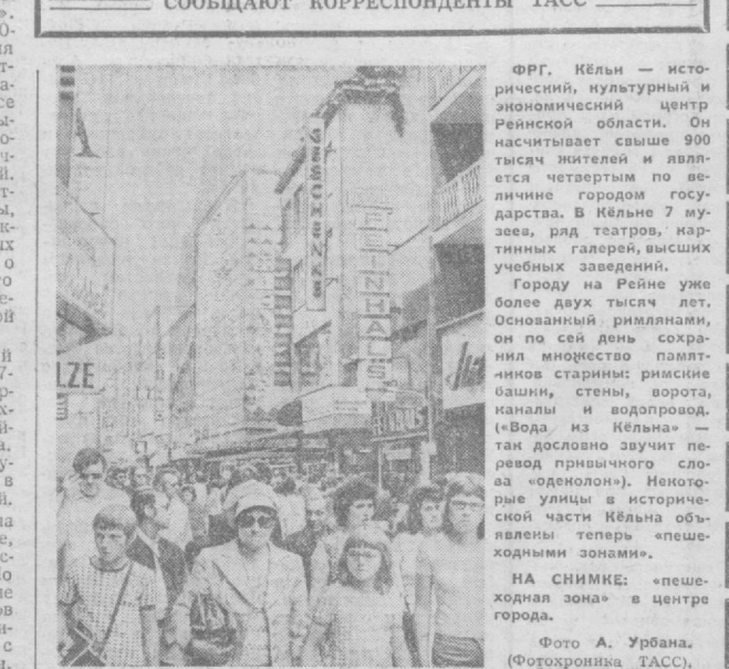
ФРГ. Кельн — исторический, культурный и экономический центр Рейнской области. Он насчитывает свыше 900 тысяч жителей и является четвертым по величине городом государства. В Кельне 7 музеев, ряд театров, картинных галерей, высших учебных заведений. Городу на Рейне уже более двух тысяч лет. Основанный римлянами, он по сей день сохранил множество памятников старины: рисинские оашины, каналы и водопровод. «Вода из Кельна» — так дословно звучит перевод привычного слова «оденоло». Некоторые улицы в исторической части Кельна объявлены теперь «пешеходными зонами».