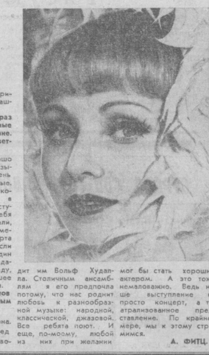
Вера Шнайденбах — артистка немецкого театра, орденом дружбы» Демократической Республики Вьетнам.