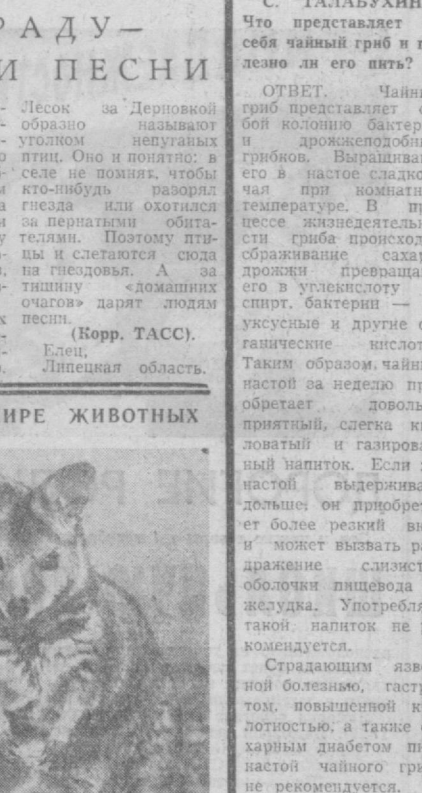
Тулеский облпотребсоюз имеет плть заерохозьяства. В них разводят лисич, пещер, норок. Этот снимок сделан в Плавском хозяйстве. В нынешнем году здесь намечено вырастить 11 тысяч норок и 5.500 пещер. НА СНИМКЕ: шенита пещера.

В МИРЕ ЖИВОТНЫХ В Новосибирском зоопарке недавно родились оцелот и кенгуренок. Малыши чувствуют себя хорошо, приваляются в весте. Появление потомства в неволе у кенгуру и оцелотов редко. НА СНИМКЕ: сибирский кенгуренок с мамой.