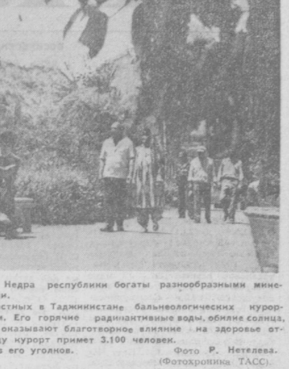
ТАДЖИКСКАЯ ССР. Недра республики богаты разнообразными минеральными источниками. Один из самых известных в Таджикистане бальнеологических курортов — Ходжа-Оби-Гарм. Его горячие радиантные воды, обилие солнца, сухой горный воздух оказывают благотворное влияние на здоровье отдыхающих. В 1975 году курорт примет 3.100 человек. НА СНИМКЕ: один из его уголков.

таться спокойные, с мягкими отделками. Ремни различной ширины и разнообразными по форме. Детали соединены в простую или сложную композицию заготовки. Эта модель обуви будет изготавливаться из эффектных материалов с красной отделкой. Тщательно осуществляется подбор цветов кож и тканей. Короче, обувь закончена, в ней четко выражена идея создания приятной легкости. Мы уверены, что все изделия Ташкентской обувной фабрики № 1 понравятся горожанам.