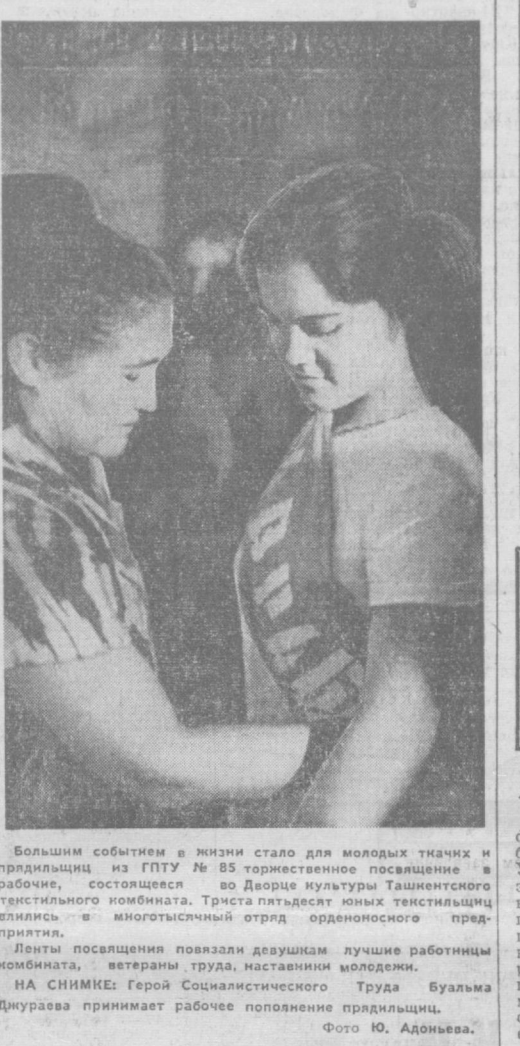
Большим событием в жизни стало для молодых ткачих и прядильщиц из ГПУ № 85 торжественное посвящение в рабочие, состоявшееся во Дворце культуры Ташкентского текстильного комбината. Триста пятьдесят юных текстильщиц влились в многоотраслевой отряд орденоносного предприятия.

Ленты посвящения повзрели девушкам лучшие работницы комбината, ветераны труда, наставники молодежи.