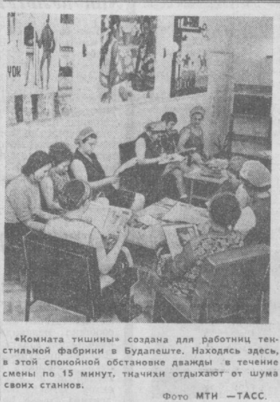
«Комната тишины» создана для работниц текстильной фабрики в Будапеште. Находясь здесь, в этой сплоченной обстановке дважды в течение смены по 15 минут, ткачихи отдыхают от шума своих станков.