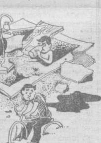
Рис. А. Алиева.

ПОПОВ, ГОРДЕЕВА, СЕВЕРОВА и другие (все 23 подписи).