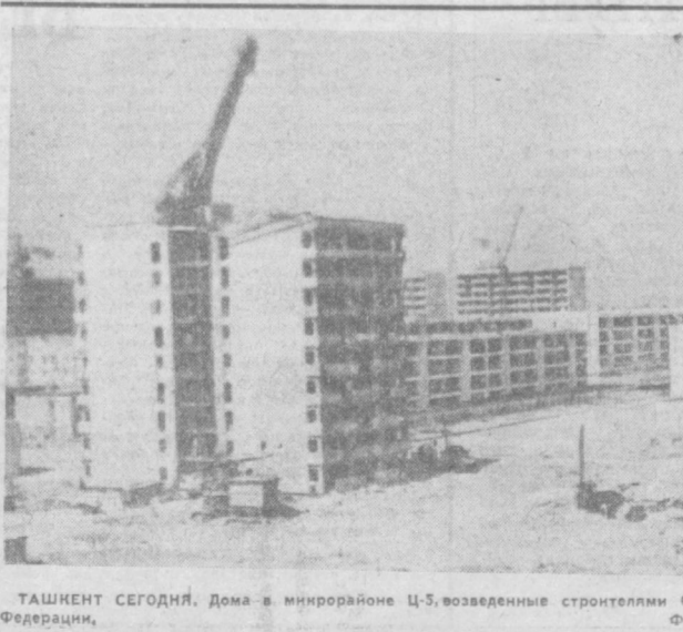
ТАШКЕНТ СЕГОДНЯ. Дома в микрорайоне Ц-5, возведенные строителями братской Российской Федерации.