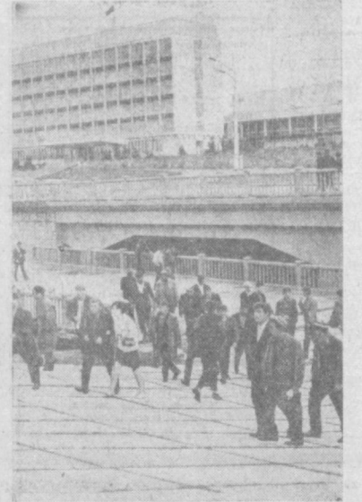
ТАШКЕНТ СЕГОДНЯ. НА СНИМКЕ: вид на мост через Анкор.