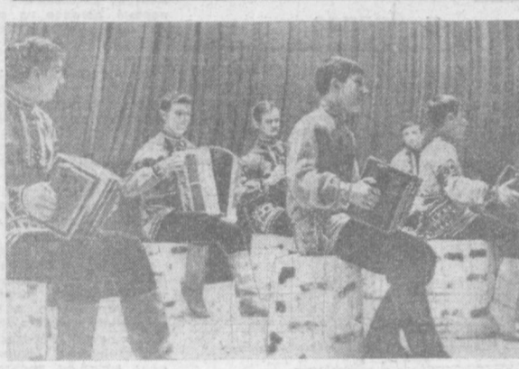
НА СНИМКАХ: сверху — Герой Монгольской Народной Республики, подполковник Дандар Лодон дарит автограф ташкентцам. Внизу — выступают гармонисты Саратовской народной филармонии.