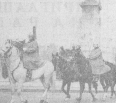
В Лондоне много мест, которые связаны с историей международного движения пролетариата.

Отвечая на вопрос о том, сколько времени потребуется для того, чтобы в стране было введено правление африканского большинства, Смит откровенно заявил, что господство белых может сохраняться «неопределенно долгое время». Смит пытался оправдать свое утверждение абсурдными теориями о минимуме превосходства европейцев над африканцами, которое, по его словам, не уменьшится, а «увеличивается». Это заявление Смит являлось по сути дела недуманным признанием того, что расисты Родезии намереваются увековечить систему расового угнетения в стране.