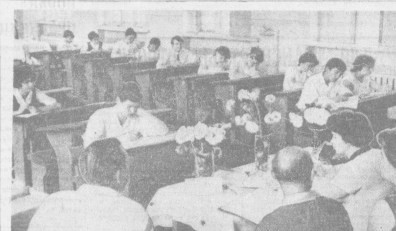
В школах идут экзамены на аттестат зрелости. Волнуются ребята, волнуются родители: «Как будет сдать очередную предмет?». Дюпозда горит свет в окнах. Еще и еще раз повторяются правила, решаются задачи, заучиваются формулы. Из экзамен каждый стремится выехать в жизнь, большую и прекрасную. Столько НА СНИМКЕ: десятиклассники школы № 21