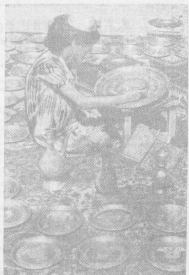
БУХАРСКИЕ МАСТЕРА художественной чеканки и 2500-летию Самарканда готовят оригинальные сувениры...