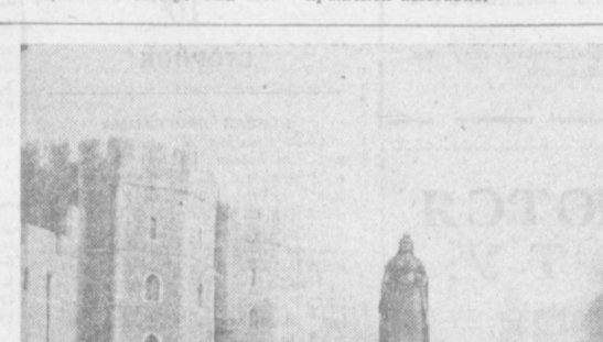
В ОБЪЕКТИВЕ — МИР

На стендах Министерства связи СССР экспонируются коллекции марок, посвященные жизни К. Маркса, Ф. Энгельса, В. И. Ленина, строительству коммунизма, покорению космоса и т. д. Особенно богата коллекция, посвященная Ленину. Она мно-