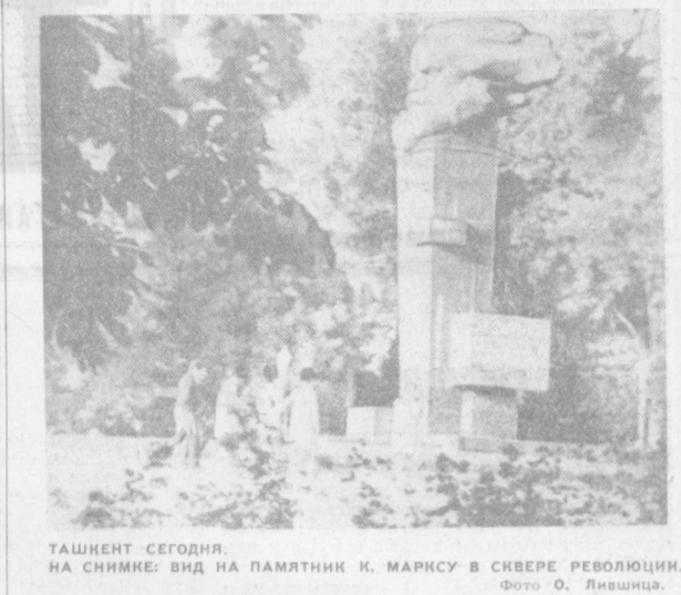
ТАШКЕНТ СЕГОДНЯ. НА СНИМКЕ: ВИД НА ПАМЯТНИК К. МАРКСУ В СКВЕРЕ РЕВОЛЮЦИИ.

— Куда летите? — спрашиваю. — В Киев. У меня в наряде имеется расписание движения самолетов. Посмотрел — полтора часа в распоряжении. Успокоилась. Услуга пустяковая, а людям спокойствие сохранил, — закончил рассказ Серажитдин. Расказывал обо всем этом, Тайезтединов вовсе не хотел прихватить. Смотрите, дескать, какой я есть! В его рассказе — любовь и профессии, глубокое уважение к родному городу, его людям. М. ФЕДОРОВ.