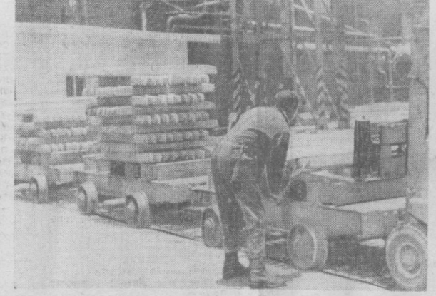
Замбия по праву считается одним из наиболее развитых в промышленном отношении государств Африки. Страна занимает третье место в мире по производству меди.

НА СНИМКЕ: бруски чистой меди, готовые к отправке за границу.