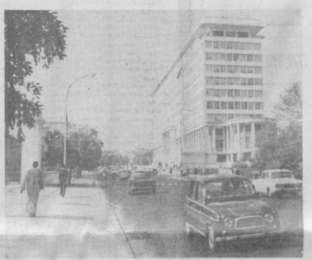
СЕНЕГАЛ. Данар по праву считается одной из красивейших африканских столиц. В городскую панораму удачно вписываются современные здания.

НА СНИМКЕ: авеню Рум — одна из центральных в Данаре.