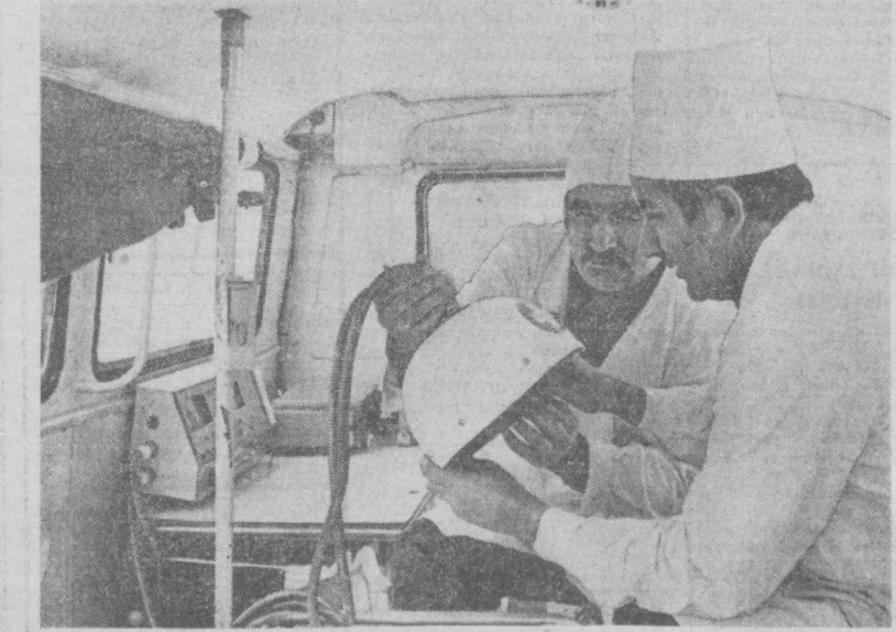
Полупроводниковый гипотермический аппарат, предназначенный для охлаждения и нагрева различных участков тела, разработан специальным конструкторским бюро Института физики Академии наук Азербайджанской ССР.