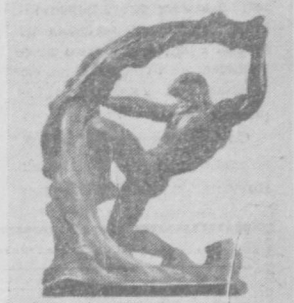
Творчество Лазаря Дубинского многогранно, глубоко, волнующе... «Деревогиги» Л. Дубинского.

Мастер психологического портрета и скульптурных композиций, Дубинский автор таких выдающихся произведений монументальной скульптуры, как памятник Г. И. Котовскому в Кишиневе, М. В. Фрунзе в Алма-Ате.