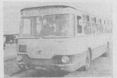
Новый комфортабельный автобус Лихачевского автозавода начал курсировать по улицам города.

Новый подъемник — один из 75 видов нефтяного оборудования, промышленный выпуск которого будет налажен бакинскими машиностроителями в этом году.