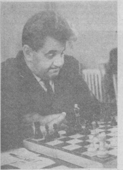
В ИВАНОВО-ФРАНКОВСКЕ проходит один из полуфиналов первенства СССР по шахматам.

ВНАМАНГАНЕ закончился первенство ДСО «Мехнат» среди мужчин и женщин. Победители этих соревнований получили право на поездку в полуфиналы первенства СССР. У мужчин основная борьба за первое место