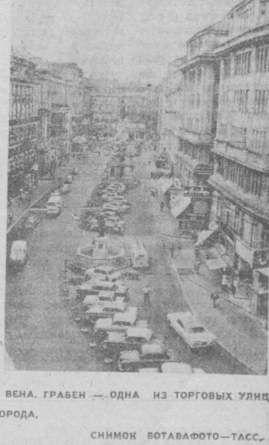
ВЕНА. ГРАБЕН — ОДНА ИЗ ТОРГОВЫХ УЛИЦ ГОРОДА. СНИМОК ВОТАВАФОТО-ТАСС.

ВАШИНГТОН. С призывом восстановить справедливость и снять все обвинения «с тысяч людей, арестованных во время мексиканских антикоммунистических выступлений», обратился в окружной суд Вашингтона «Союз защиты гражданских свобод». В иске союза указывается, что массовые аресты производились полицией в нарушение конституционных прав. Уже первые дни судебных разбирательств показали, что представители обвинения не могут представить буквально никаких доказательств «нарушений», якобы совершенных арестованными.