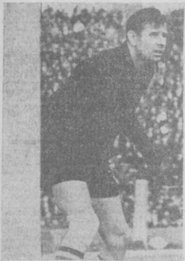
стали знамениты. Ему аплодировали на стадионах Англии и Австралии.

326 матчей провел Яшин за клуб «Динамо», и в девяти из них отразил пенальти. Яшину принадлежит своеобразный рекорд СССР: в 27 календарных матчах он пропустил всего 6 мячей. «Яшин — это один из лучших вратарей мира, которых я знал за всю мою футбольную карьеру», — сказал о нем Пеле. — Я поклонник Яшина. Все, что говорит о нем хорошего, — чистая правда. Едва ли появится другой вратарь с такими способностями, какими он обладает». Да, Яшин неповторим. Он создал тип нового вратаря — существование одиннадцатого полевого игрока. Смелые выходы Яшин