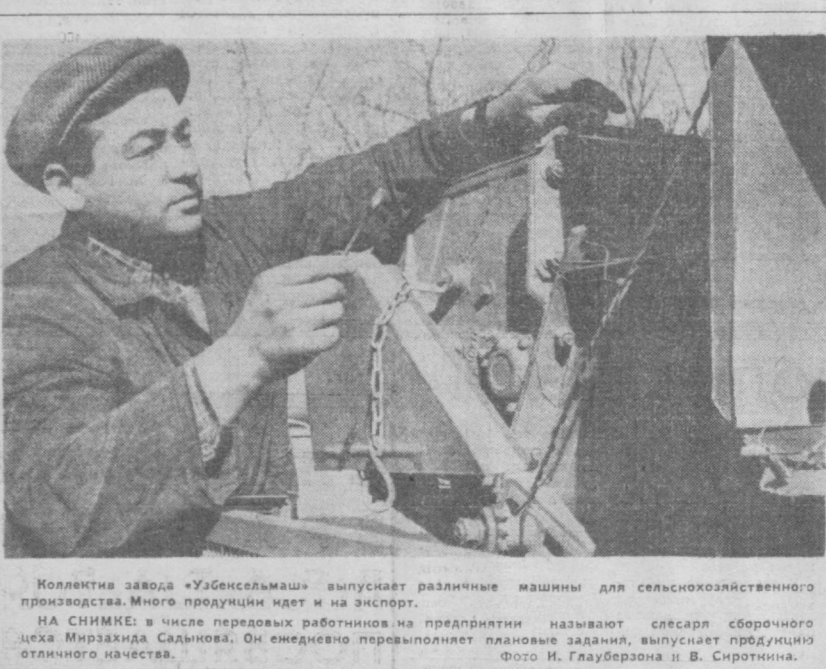
Коллектив завода «Узбексельмаш» выпускает различные машины для сельскохозяйственного производства. Много продукции идет и на экспорт.

Долг строителей — откликнуться на это требование. В.ЛАПИНА.