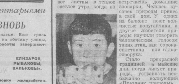
нует пение птиц, щеполет листья в теплое светлое утро, когда на рабочих поселках встречаются домашние зоопарки. Человек кусочек природы принес в свой дом. У одних на балконе поют волнистые попугайчики, а другие любители природы изучили повадки челоушеским голосом таня птиц как сорока-сплетница или галка-говоруха. Стало прекрасной традицией в майские дни, когда ликует природа, устраивать необычайно волнующий «Праздник природы». К радости посетителей пернатых выставки можно сообщить, что и на сей раз в «смотрюнах» птичьей красоты

ЛЮДЕЙ всегда очаровывает красота природы. Она открывает нам мир прекрасного. Кого не волнует участие королевы всех «птичьих балов» — оранжево-голубая Ара. Ара охотно болтает на бытовые темы, похвалится своей красотой, приветствует гостей и этим умилет посетителей птичьего праздника. Нужно ли здесь вспоминать, сколько дипломов первой степени получила Ара на выставках. Участниками «птичьего бала» окажутся не только экзотические птицы — попугаи, ткачики, канарейки — наравне с ними примут участие в соревнованиях и певцы местной фауны — майна, жаворонки, соловей, скворцы, овсянки, зеленушки и другие пернатые артисты. Впервые очень широко будут представлены на выставке животные различные породы собак. В эти дни готовится к своему «выступлению» черные и белые шпильки, изумительно нежные французские болонки и другие декоративные собачки. Из мелкопятающихся будут сирийские хомячки, кролики, мыши-альбинос. Как всегда, прекрасный фейерверк красоты животных представит перед судьями — жюри, которые объективно оценят и достоинство претендентов на дипломы, и конечно же, похвалу за труд