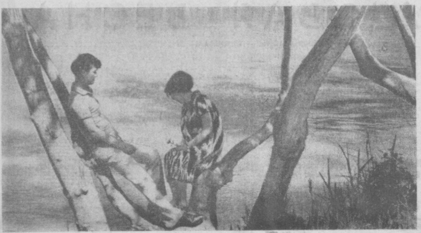
В жаркий день на Анхоре.

ном: в любви к блестящему роману. У каждого, кто читает и перечитывает его, наверняка сложилось вполне определенное и яркое представление о героях. Совпадает ли оно, это личное представление каждого, с тем, что он увидит на экране? А может быть, это и не обязательно? Роль «уездного председателя комарчей» — неудачника Кысы Воробьянинова сыграл Сергей Филиппов. Это, безусловно, еще один интересный тип в галерее, созданной мастером комедийного жанра. М. Пугачкин — отец Федор, Ю. Никулин — «рабочник метод Коровников» — артист Э. Гарин. Как говорят, знакомые все лица. И лишь с одним представителем блестящего ансамбля зрители познакомиться впервые — это актриса, сыгравшая Людочку Злочоку. В роли дебютует студентка ГИТИСа Наталья Воробьева, о героине которой в романе сказано лишь то, что она не ужасалась в особых приметах — она была красива. Итак впереди — новая, теперь уже экранная встреча с замечательным произведением Ильфа и Петрова. Е. ХОРЕВА, корр. ТАСС. Москва.