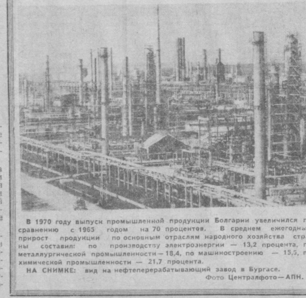
В 1970 году выпуск промышленной продукции Болгарии увеличился по сравнению с 1965 годом на 70 процентов. В среднем ежегодный прирост продукции по основным отраслям народного хозяйства страны составил: по металлургической промышленности — 18,4, по машиностроению — 15,5, по химической промышленности — 21,7 процента. НА СНИМКЕ: вид на нефтеперерабатывающий завод в Бургасе.

В странах социализма Межкооперативные объединения БУХАРЕСТ. Практика социалистического преобразования румынской деревни вызвала и жизни новую форму кооперации — межкооперативные объединения. Такие хозяйства создаются на паху нескольких артелями, которые трудно решать в одиночку сложные проблемы ведения производства на современном уровне. В ряде районов страны уже созданы и успешно действуют объединения по совместному откорму крупного рогатого скота, птицы, выращиванию ранних овощей, ирригации. Так, например, в уезде Яломиты 45 кооперативов создали первое в республике объединение по производству строительных материалов. Новая фирма будет ежегодно выпускать до 15 миллионов штук кирпича, 10 миллионов плиток черепицы, бетонные трубы и другие изделия, спрос на которые сейчас особенно велик в связи с расширением масштаба жилищного строительства в сельской местности. Ф. АНГЕЛИ.