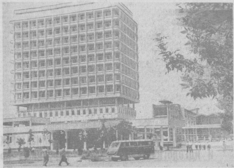
Перед вами новое административное здание государственного университета имени В. И. Ленина в вузгородке.

Сейчас в районе проходят встречи избирателей с теми, кого единодушно назвали кандидатами в депутаты коллективы предприятий и учреждений, институтов и строки... Идет широкая агитация среди населения за кандидатов блока коммунистов и беспартийных.