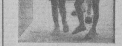
НА СНИМКЕ: вселяются очередные новоселы.

Материалы о жизни и делах труженников Сабир Рахимовского района, подготовлены корреспондентами «Вечернего Ташкента» Р. ГАБДУЛЛАКОВЫМ и В. ЕМЕЛЬЯНЦЕВЫМ , сотрудниками Ташкентской студии телевидения режиссером И. РАЗУМАТОВЫМ и главным редактором информационной программы «Ахборот» А. ТАДЖИЕВЫМ .