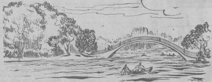
На Комсомольском озере.

на еще нет никаких строений, и в те часы, когда вспыхнули звезды, на берегу его раскинулись походные палатки.