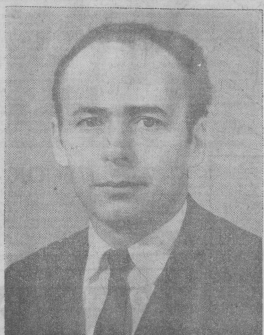
В. И. Пацаев.