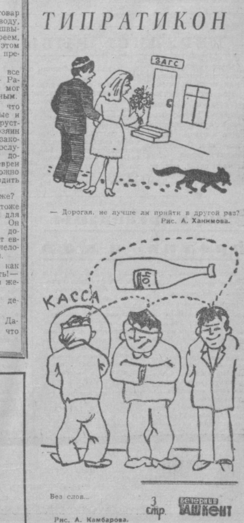
Рис. А. Камбаров.