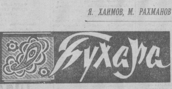
Отрывок из романа «Расстояние до счастья»

не шевелься, не произноси ни одного слова. На его глазах были два — богатого, уважаемого человека. Самого дядю! А Рафаиль по-прежнему надрыла. — Я русско-подданный!!! Русско-подданный!!! Я подданный русского царя! Эти слова, наконец, двинулись от городских ворот. Рафаиль тяжело дышал. Вот как началось его путешествие. Он искал в этом городе спасения от большевиков, а солдаты эмира встретили плеткой, изверги. Да еще были на глазах нищего племянника. — Будьте вы про-