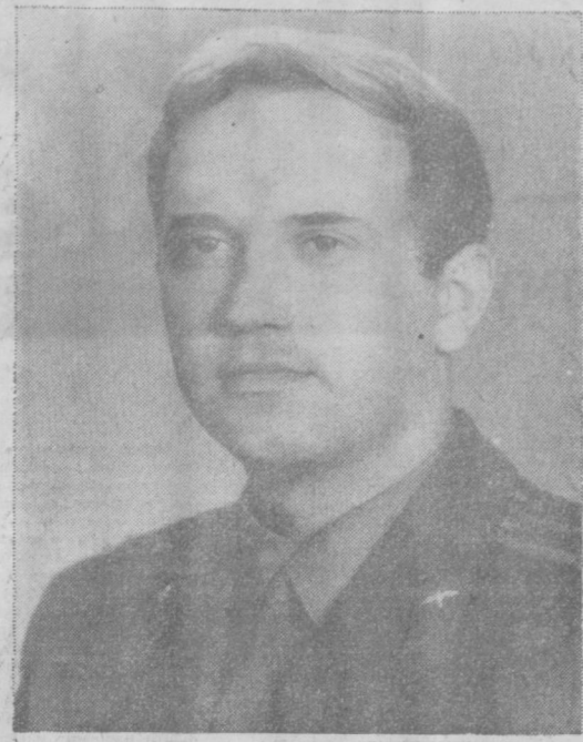
Г. Т. Добровольский.

Председатель Президиума Верховного Совета СССР Н. ПОДГОРНЫЙ. Секретарь Президиума Верховного Совета СССР М. ГЕОРГАДЗЕ. Москва, Кремль, 3 июня 1971 г.