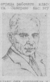
Славу она сохранила и приумножила.

А дальше будет еще лучше, краше! А. БЕРЕЗИН, «Московская правда», № 117 от 20 мая 1971 года.