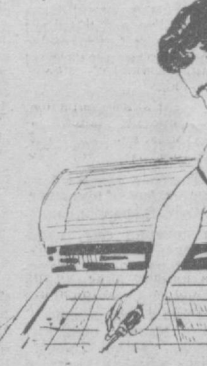
Ваших слов, рост количественный сопровождался и ростом качественным.

— За последние несколько лет работники издательства получили около тысячи квартир, а молодые рабочие — отличные общежития.