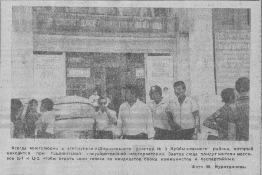
Всегда многолюдно в агитунке избирательного участка № 3 Куйбышевского района, который находится при Ташкентской государственной консерватории. Завтра сюда придут жители массивов Ц-1 и Ц-2, чтобы отдать свои голоса за кандидатов блока коммунистов и беспартийных.