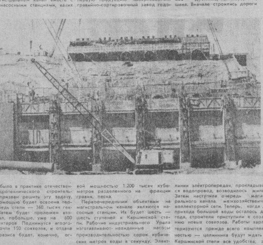
отрезок времени. В ближайшие пять лет, как это предусмотрено Директивой XXIV съезда КПСС по народному хозяйству, работы по освоению Каршинской степи будут интенсифицированы, и первые 85 тысяч гектаров станут в 1975 году орошаемой пашней. Многие для этого уже сделано. Еще больше предстоит сделать в ближайшее время. «Каршинстрой» быстро и целенаправленно создает мощную производственную базу — комбинаты строительных материалов и деталей, ремонтные заводы! На днях, например, выдал первую продукцию Шахрисабзский гравино-сортировочный завод год-

тоже не маленький, мощностью 12,5 тысяч киловатт. Эти насосы уникальны, и перед запуском в серию их будут всесторонне испытывать на первых двух станциях. Испытания планируются провести уже в этом году. Канал же будет пущен через два года, и к этому времени в здании станции, в противобуферной зоне, уже уложат миллион кубометров бетона. В Чарваке за восемь лет уложили вдвое меньше.