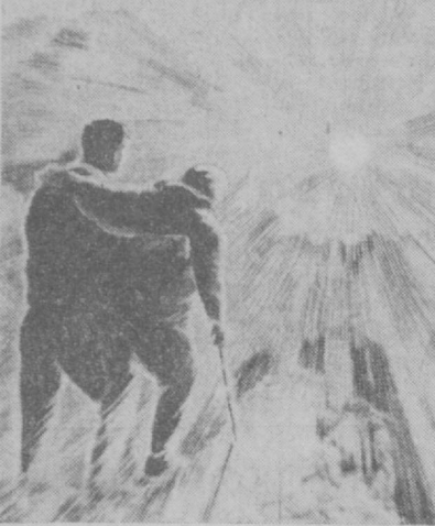
— Эх, это ведь видеть надо!

У Жукова есть картина, с которой, кажется, сейчас брызнут крошечные тюльпаны. Не тронули бы они меня так, если бы в этих цво-