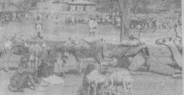
ВАЗАР — НЕУЖЕМЛЕМАЯ ЧАСТЬ КРЕСТЬЯНСКОГО БЫТА В ЭФИОПИИ. ЭТО МЕСТО ВСТРЕЧИ ДУЗЕИ, ОДИКА, ВЕСЕЛЫХ, ЗДЕСЬ ПРОДАЮТ И ПОКУПАЮТ СКОТ, ШКУРЫ, ЗЕРНО.

«Бесконечное» продолжение войны в Юго-Восточной Азии, отметил он, делает ставку на сохранение антинародного режима Тхиен-Ки. «Хотя совершенно очевидно, что народ Южного Вьетнама хочет мирного урегулирования путем переговоров», — подчеркнул он. Ни правительство Никсона, ни представители сейгонского режима не проявляют желания вести серьезные переговоры в Париже, указал Гарриман. По его словам, программа «ветнамизации», осуществляемая правительством, означает «бесконечное» продолжение войны руками местных марionеток. Необходимо, подчеркнул он, установить законодательным путем твердую дату окончания вывоза всех американских войск из Юго-Восточной Азии. Гарриман призвал конгресс использовать свои конституционные полномочия и отказать в ассигновках на продолжение войны после 31 декабря этого года.